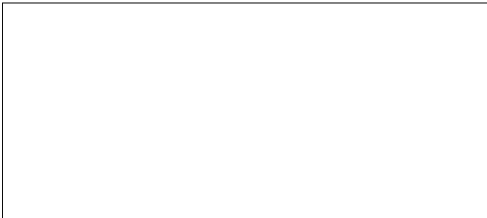
ภาพที่ ... ..